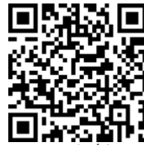
Escanee el código si desea verificar datos

CONSIDERACIONES LEGALES RELATIVAS A LOS EXAMENES DE INGRESO: Las Resoluciones 2346 del 11 de julio de 2007 y 1918 de Junio 5 de 2009 del Ministerio de la Protección Social (actualmente Ministerios de Trabajo y de Salud y Protección Social) reglamentan la práctica y contenido de las evaluaciones médicas ocupacionales de ingreso, con el objeto de determinar la existencia de restricciones para el trabajo a desempeñar, acorde con los requerimientos definidos por el empleador en el perfil del cargo. También establece que la Empresa solo puede conocer el CERTIFICADO MÉDICO DE INGRESO del aspirante. Los documentos completos de la Historia Clínica Ocupacional están sometidos a reserva profesional y quedan bajo nuestra guarda y custodia, según lo establecido en la Resolución 1918 de Junio 5 de 2009 y el trabajador puede obtener una copia de ellos cuando lo requiera, entendiendo que hacen parte integral de su historial médico.